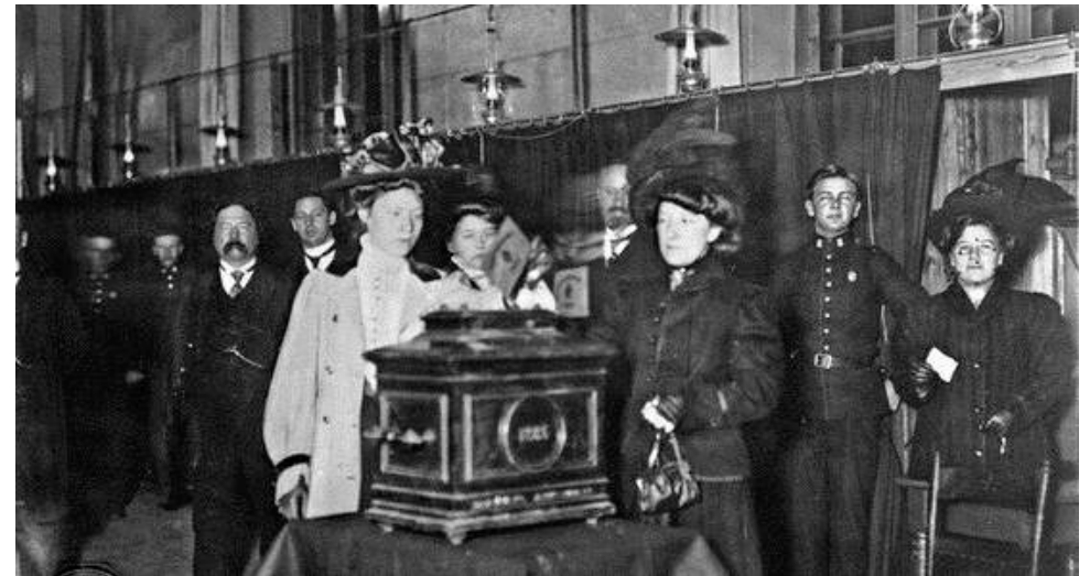
Første kvinne legg stemmeseddelen i urna ved kommunevalget i 1910.

© Universitetsbiblioteket i Bergen, www.uib.no/ub Tekst: Jan Olav Gatland, Bibliotek for humaniora Formgjeving: Pedro Vásquez, Manuskript- og librarsamlingane Omslag: Pedro Vásquez Katalogen er også tilgjengeleg på UBs heimeside.